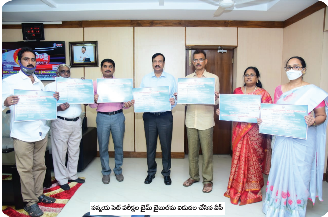
నన్నయ సెట్ పరీక్షల టైమ్ టైబుల్ను విడుదల చేసిన వీసీ